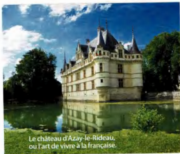
Le château d'Azay-le-Rideau, ou l'art de vivre à la française.